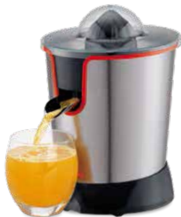
Imágenes de carácter ilustrativo